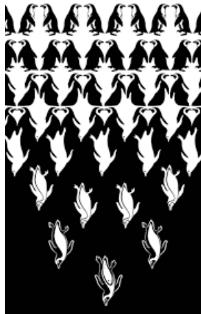
ภาพและพื้นแบบสองนัย